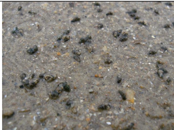
Fig. 17 Wadslakjes rondkruipend op zandsubstraat (foto E. Dumoulin).