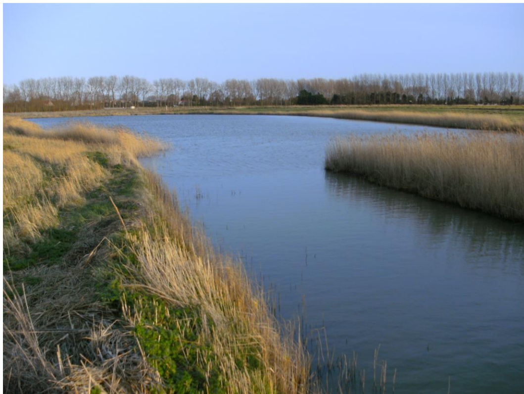
Fig. 8 Het Dievegat