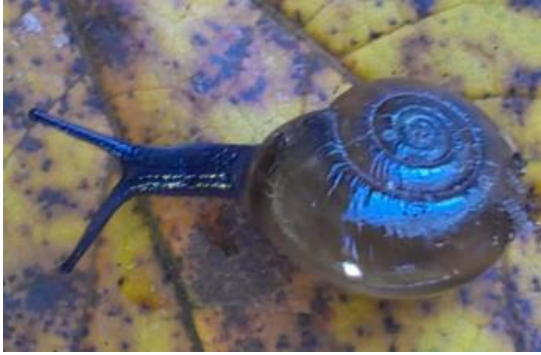
Fig. 1 Oxichilus draparnaudi