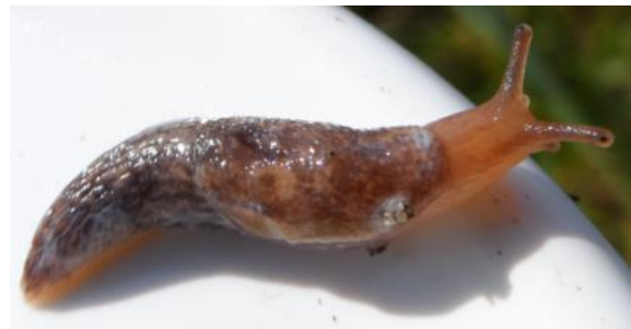
Fig. 6 Deroceras reticulatum (Het Dievegat)