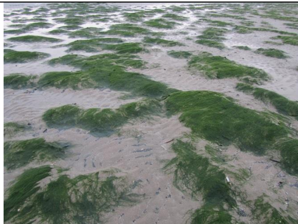
Fig. 18 Veldje darmwier Enteromorpha sp. op het strand.