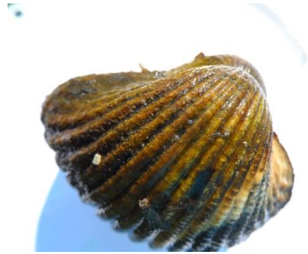
Fig. 13 Cerastoderma lamarcki (Het Dievegat)