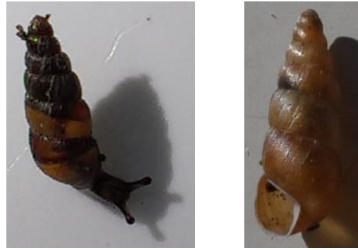
Fig. 2 Balea heydeni (= B. sarsii ) (Blinckaertduinbos)