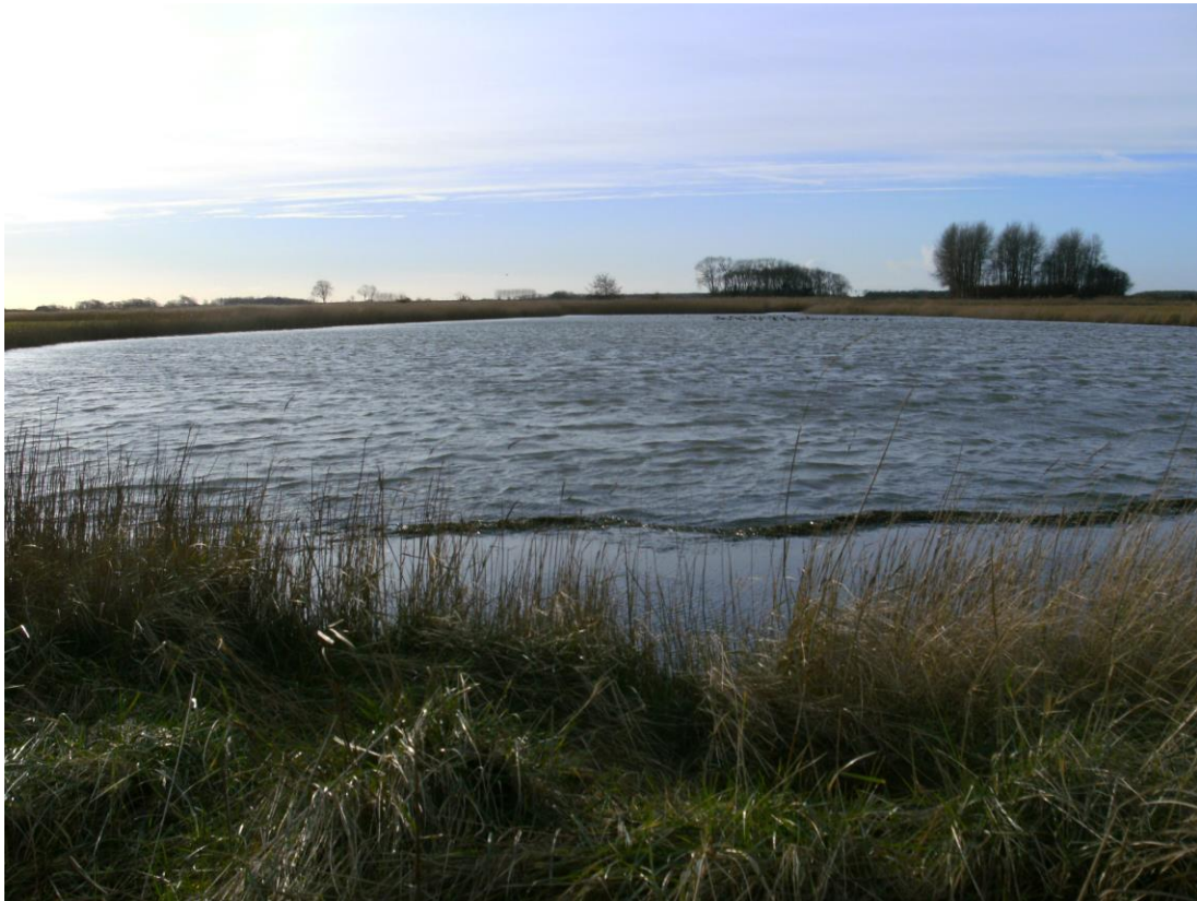
Fig. 7 Het Dievegat