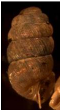
Fig. 5 Truncatellina cylindrica (Golf Knokke)