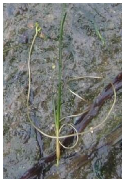
Fig. 10 Spiraalruppia Ruppia cirrhosa