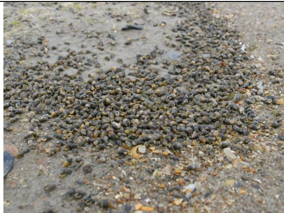
Fig. 15 Wadslakjes inactief op uitgedroogd substraat (foto E. Dumoulin).

Met al deze gegevens wordt de natuurhistorische waarde van dit stukje Belgische strand minstens bevestigd. Op hun tentatieve schaal van biologische waardering geven Speybroeck et al. (2005: p. 109) voor het zoöbenthos uit het gebied een "2" (waardevol). Ons inziens echter verdient het zeker een "2+" en mag het gerust onder de "3" (zeer waardevol) van hun schaal gecategoriseerd worden.