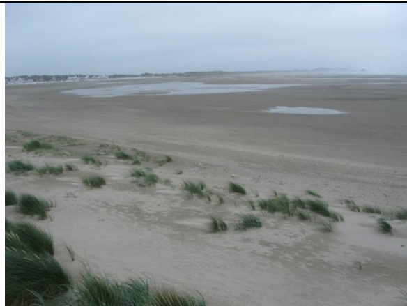
Fig. 16 Stranddepressie met achterblijvend vloedwater.