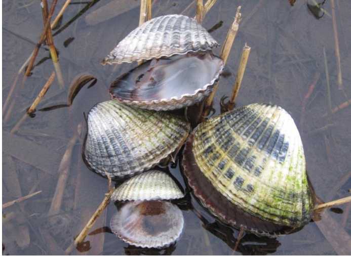
Fig. 12 Cerastoderma lamarcki (Het Dievegat)