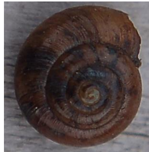
Fig. 4 Zonitoides nitidus.