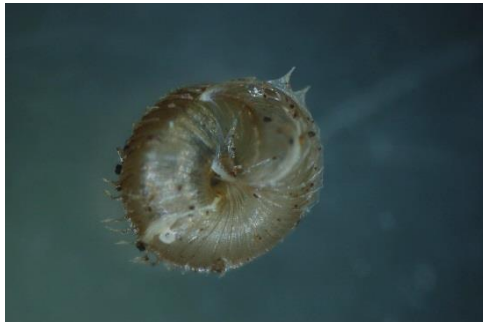
Fig. 3 Acanthinula aculeata (Blinckaertduinbos)