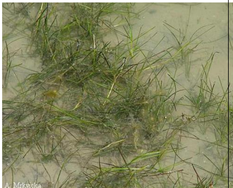
Fig. 11 Spiraalruppia Ruppia cirrhosa